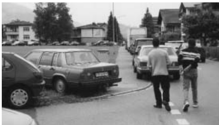
Grossanlass in Balzers – die effektive «Zentrumsparkierung» und der dafür vorgesehene Parkplatz nur 150 m entfernt vom Zentrum.