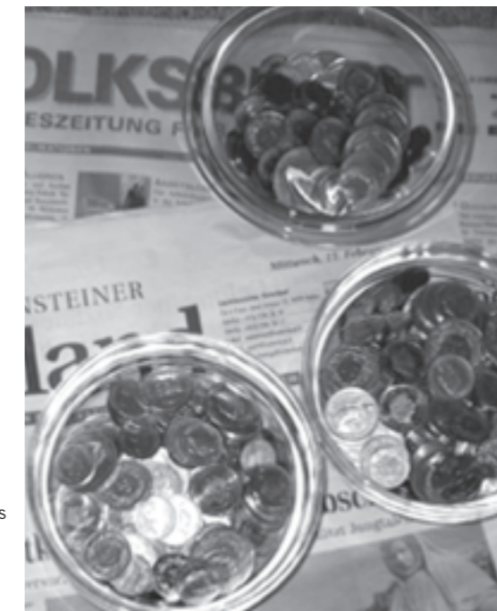
Die Landesmedien werden aus unterschiedlichsten Töpfen gefördert – einer davon heisst «Kundmachungen».

te, und die Tageszeitungen nicht weniger parteipolitisch berichten als vor der Medienförderung, kann man die Zweckmässigkeit der Medienförderung durchaus in Frage stellen. Jedenfalls scheint die Vielfalt nicht markant zugenommen zu haben. Mit der Umwandlung von Radio L in einen Staatssender ist auch die wegen der Kontrollfunktion erwünschte Distanz zwischen Mediensystem und politischem System kaum grösser geworden.