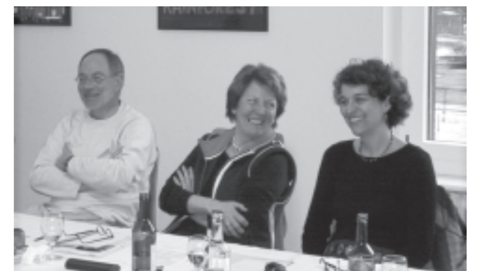
Zu lachen gab es einiges...