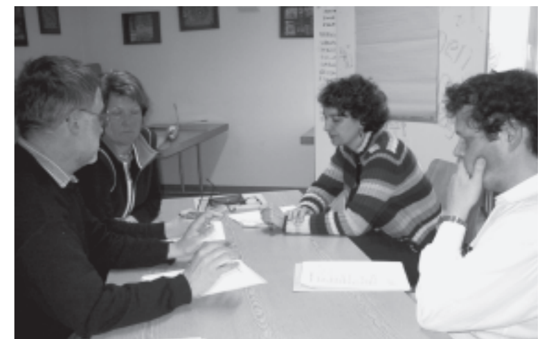
Nachdenken über die Zukunft...