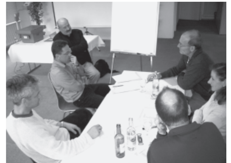
Eine der Arbeitsgruppen, die sich intensiv mit dem Parteiprogramm auseinandersetzt.

Das Freie Liste-Wahlteam 2005 hat sich am 7. Februar 2004 zum ersten Meeting getroffen, um die Weichen für die Wahlen 2005 zu stellen. Als Partei mit einem klaren Programm will die Freie Liste auch starke KandidatInnen nominieren, um ihr Gewicht im Landtag zu erhöhen. Sie ist die einzige Partei, die ohne zu Taktieren zu ihren Werten steht und sich dafür einsetzt. Nein zu Alleinregierungen. Mit drei FL-Abgeordneten will die Freie Liste in Zukunft verstärkt Macht kontrollieren, mitgestalten und den Landtag stärken.