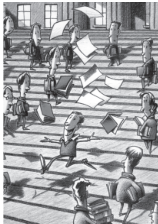
Erfolg im Klassenzimmer wird durch motivierte und gut ausgebildete Lehrpersonen erzielt.

Unser Bildungssystem baut nach der Primar- und Sekundarstufe auf zwei Schienen auf: dem theoretischen Bildungsweg über ein Gymnasium bzw. eine Fachmittelschule oder dem praktischen Bildungsweg über eine Lehre. In den vergangenen Jahren wurden erhebliche Anstrengungen unternommen, um die praktische Schiene «Lehre» attraktiv und zukunftsweisend zu gestalten. Mit der Berufsmatura steht heute jedem Lehrling der Zutritt an die Fachhochschulen offen. Die Qualität und Attraktivität der Fachhochschulen hat derart zugenommen, dass sie zunehmend auch für Gymnasiasten zu einer Alternative zum Uni-Studium werden. Und doch: In erster Linie wurde die Fachhochschule als Studienangebot für motivierte Leute mit einer Berufsausbildung geschaffen. Damit dieses «neue» Bildungssystem mit den zwei gleichwertigen Schienen richtig zu greifen beginnt, sind einige Voraussetzungen unabdingbar: