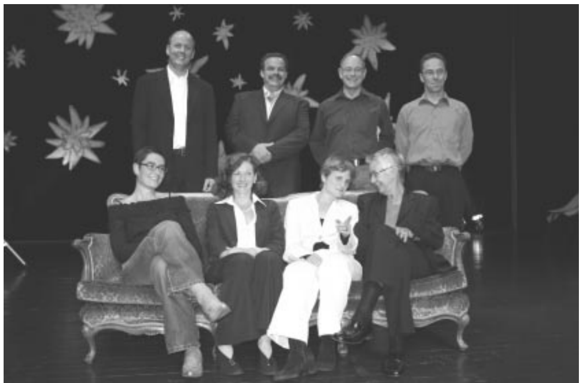
Der neue Vorstand und die Geschäftsleitung auf der Festbühne.

Der neue Vorstand wurde bereits anlässlich der Jahreshauptversammlung vom 20. Juni 2005 durch die Mitgliederversammlung gewählt. Auf Anhieb fanden sich sieben Personen, die bereit sind, sich im Vorstand zu engagieren. Der permanente Kontakt mit der Geschäftsleiterin, dem Präsidium und der FL-Fraktion garantiert eine optimale Kommunikationsstruktur.