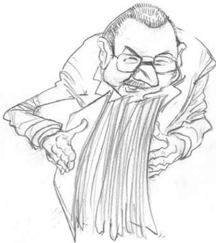
... aus 10 Belegexemplaren

Weitere Anforderungen für Medienförderung