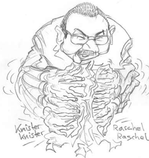
... in 10 Bastelsekunden