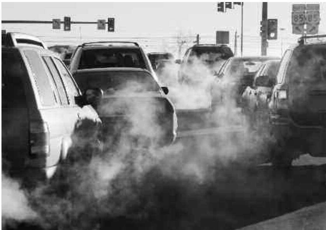
36% der CO 2 -Emissionen Liechtensteins stammen aus dem Verkehr.

Strom wird auf unterschiedliche Weise aus Primärenergien wie Öl, Gas, Kohle, Uran oder im besten Fall Wasserkraft, Sonne oder Wind gewonnen. Stromsparen ist deshalb effizienter Klimaschutz. Liechtensteiner verbrauchen überdurchschnittlich viel Strom: Mehr als 10 000 kWh pro Kopf und Jahr, ein Zürcher nur 6000 kWh. In den