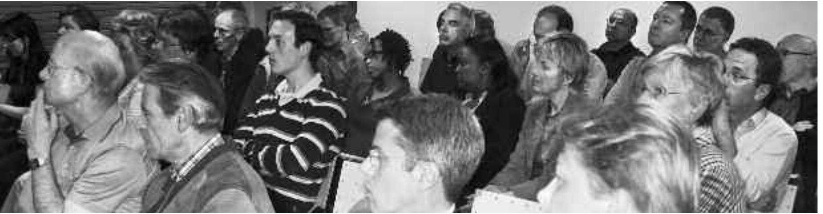
FL-Veranstaltung vom 7.5.2008 im Schaaner Pfarrezentrum

«Die Thematik des Stiftungsrechts ist in den Diskussionen der letzten Wochen und Monate immer wieder mit Fragen der internationalen Kooperation, der Rechtshilfe oder der Steuerpolitik vermischt worden. Die Stiftung ist gar als Vehikel der Steuerhinterziehung dargestellt worden.[...] Als kleines souveränes Land ohne Medienmacht sind wir auf eine professionelle und vor allem krisenfeste Kommunikations- und Informationspolitik angewiesen. ... »