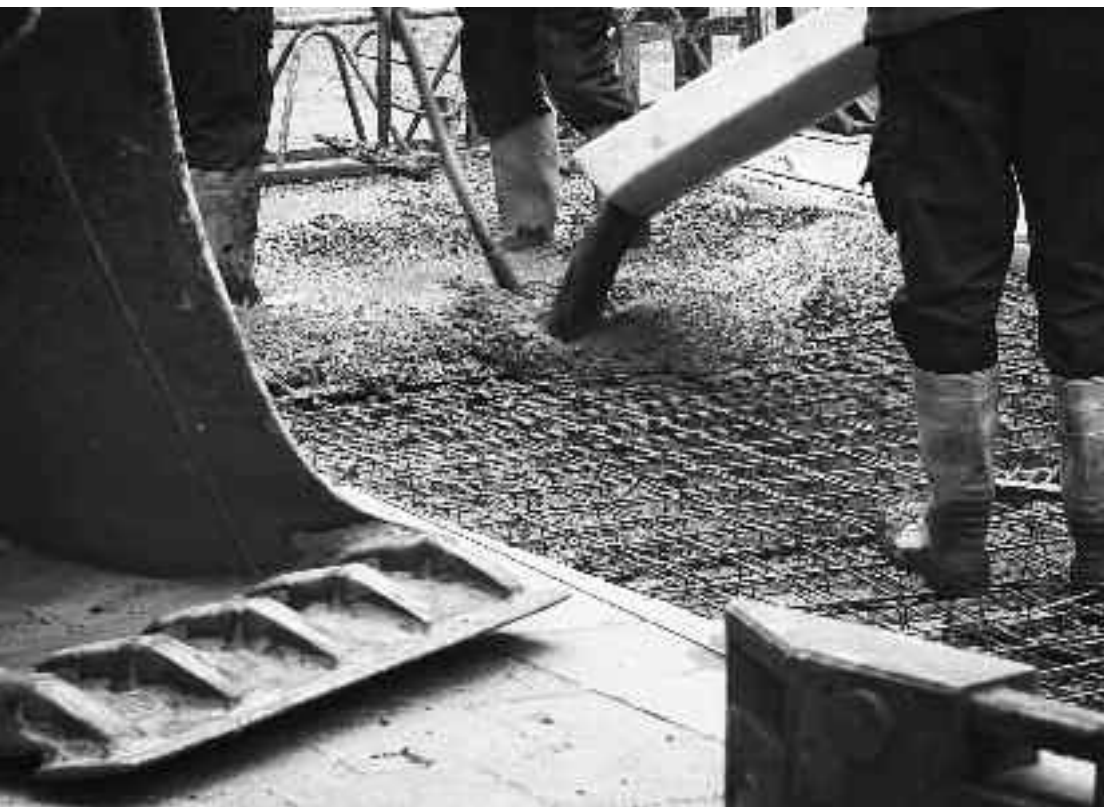
Neue Strassen sind keine Lösung im Zeitalter von Peak Oil und Klimawandel

In Liechtenstein ist man der Ansicht, dass mit der neuen Variante für eine Südumfahrung die Lösung gefunden worden sei. Die Würfel für den Bau der Tunnel-Varianten-Spinne 5.3.a oder eine Ähnliche sind jedoch noch lange nicht gefallen.