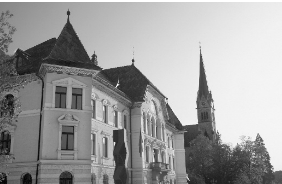
Das Verhältnis zwischen Staat und Kirche ist immer noch ungeklärt.

Auf eine Kleine Anfrage der Abgeordneten Pepo Frick und Albert Frick in Bezug auf das weitere Vorgehen zur Regelung des Verhältnisses zwischen Staat und Kirche, gab sich die Regierung ziemlich bedeckt und flüchtete sich in die liechtensteinische Redewendung einer «tragfähigen liechtensteinischen Lösung».