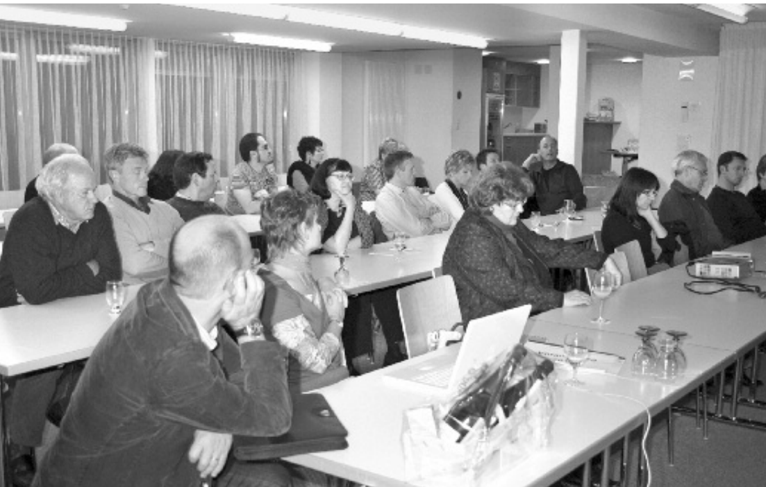
Die Information und Abstimmung über ein NEIN zur Initiative erfolgte im Anschluss an die Diskussion über mögliche Sparpotentiale.