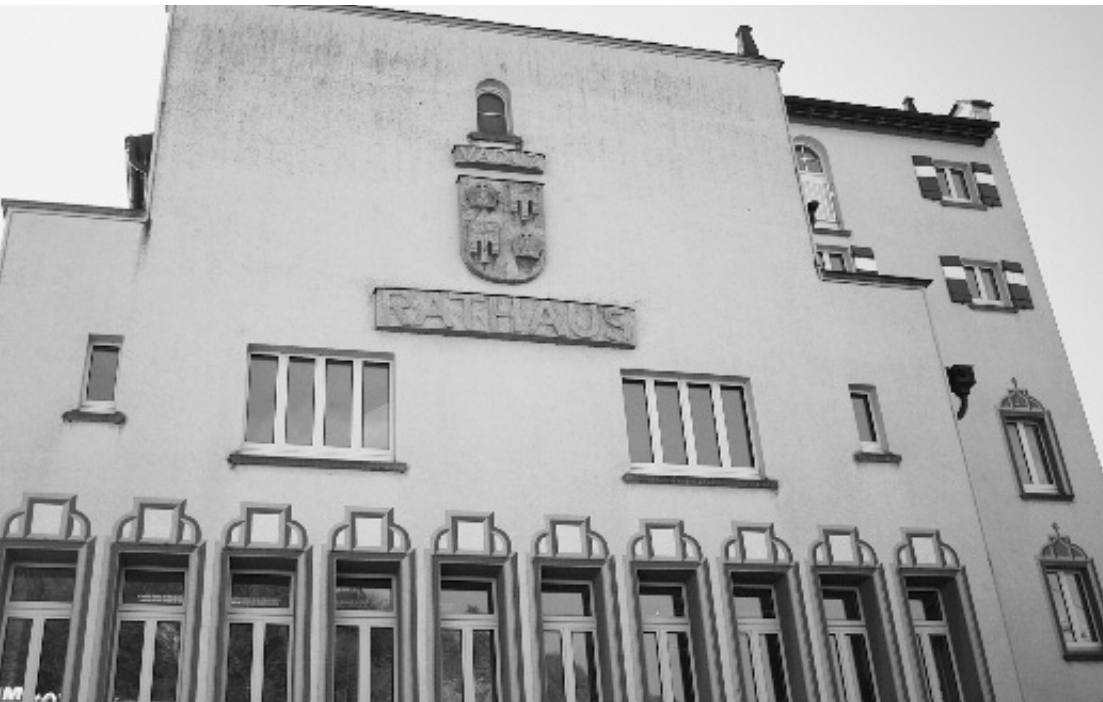
Das Vaduzer Rathaus – das Objekt, an dem sich die Geister scheiden.