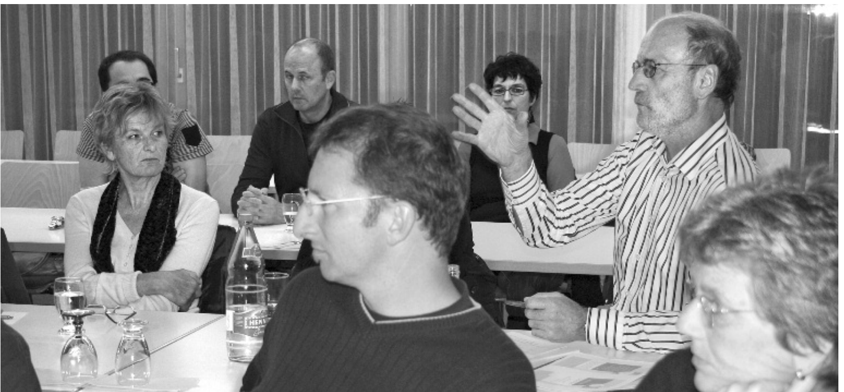
Eine Erhöhung der Erwerbs- und Vermögenssteuer sowie eine Überarbeitung des Finanzausgleichs an die Gemeinden muss auch diskutiert werden.